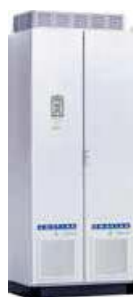
VFX/FDU48: Модель 600–750 (I)