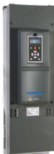
Типоразмер E2 IP20