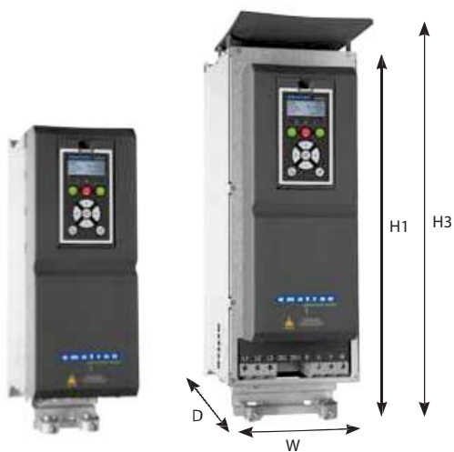
Типоразмер C2/C2(69) IP20