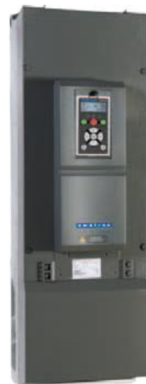
Типоразмер FA2 IP20