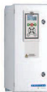
VFX/FDU48/52: Модель 061 - 074 (D)