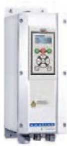
VFX/FDU48/52: Модель 026 - 046 (C)