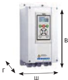
VFX/FDU48/52: Модель 003 - 018 (B)