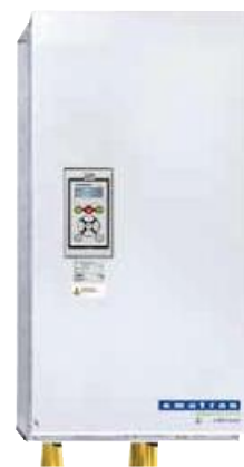
VFX/FDU48: Модель 430 - 500 (H) модуль IP20