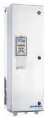
VFX/FDU48: Модель 090 - 175 (E)