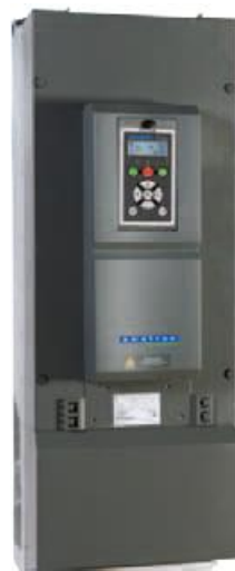
Типоразмер F2 IP20