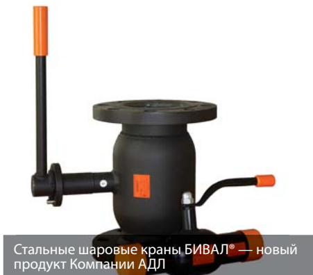
Стальные шаровые краны БИВАЛ® — новый продукт Компании АДЛ

Учитывая, что большую часть приглашенных составляли представители крупнейших компании, работающих в сфере ЖКХ и строительства, экскурсионная программа была выстроена с акцентом на следующие участки, где выпускаются уже хорошо известные многим потребителям продукты, такие как: дисковые поворотные затворы ГРАНВЭЛ®, обратные клапаны ГРАНЛОК®, задвижки с обрешиненным клином, вентили, фильтры, предохранительные клапаны ПРЕГРАН® и сепараторы пара ГРАНСТИМ®. Гости посетили также участки производства насосных установок ГРАНФЛОУ® и шкафов управления ГРАНТОР®.